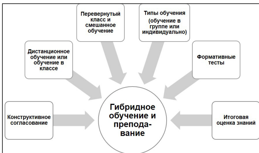
Рис. 2. Гибридное обучение и преподавание