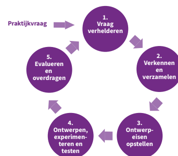
Figuur 1: Werkwijze iXperium designteams

In een multidisciplinair designteam worden deelnemers in een proces van co-creatie aangezet tot grensoverschrijdend, multidisciplinair samenwerken (Kral, Van Loon, Gorissen, & Uerz, 2019). Vanuit de literatuur is bekend dat als mensen vanuit verschillende denkkaders samenwerken aan hetzelfde vraagstuk, er verschillen in mentale modellen zichtbaar worden. Daarmee ontstaat ruimte voor ontwikkeling en groei (Akkerman & Bakker, 2011; Miedema & Stam, 2008).