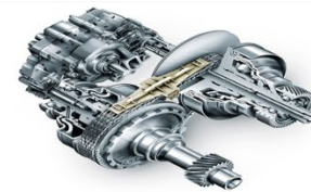
Figuur 1 Van schets tot moderne CVT [4] [5] [6]