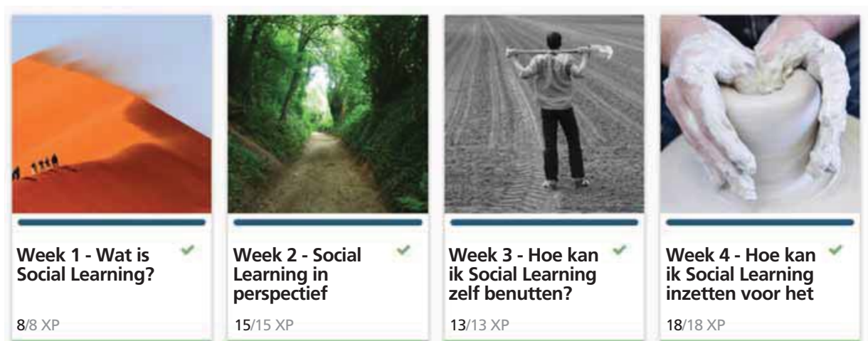
Figuur 1. Heldere opbouw: onderwerpen in de MOOC

In mei 2015 startten we met zo'n 450 inschrijvers (zie tabel 1). Zo'n 60% van de deelnemers waren HRD'ers. Daarnaast deden beleidsmedewerkers, docenten en studenten mee.